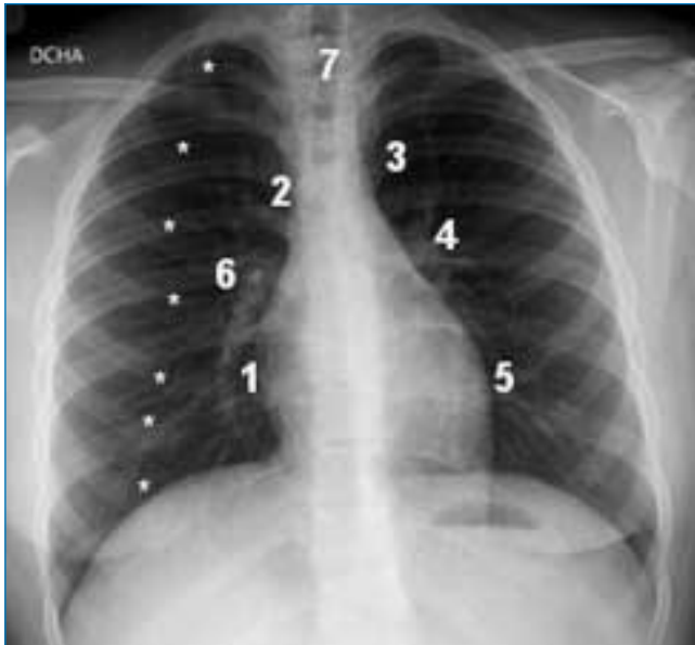
Figura 3. Radiografía normal anteroposterior. 1: silueta de la aurícula derecha; 2: vena cava superior; 3: cayado aórtico; 4: arteria pulmonar izquierda; 5: ventrículo izquierdo; 6: arteria pulmonar derecha; 7: tráquea. Los arcos costales anteriores están marcados con asteriscos