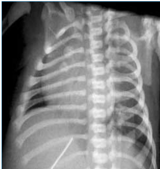
Figura 1. Radiografía rotada de un recién nacido. Los núcleos de osificación del esternón se proyectan sobre el hemotórax derecho

Una vez tenidas en cuenta estas sencillas cuestiones se procederá a la lectura de la Rx.